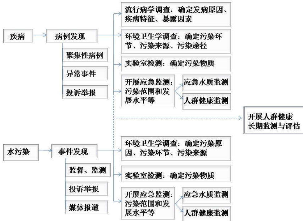
图 2 突发水污染事件现场调查工作内容